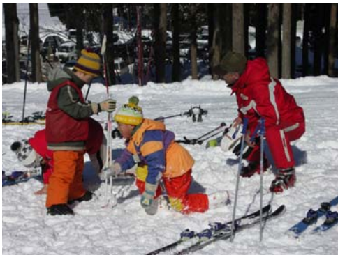
ベテランのコーチも、小さなアスリートには板を履く前の“心の準備”に力を入れます