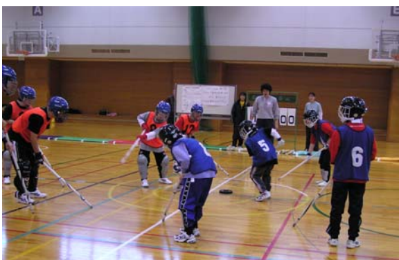
歴史の長いSON・石川のチームは、さすがに上手でした