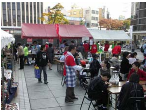
福祉関係施設の協力を得て6つのテントは、いろいろな催しで賑わいました