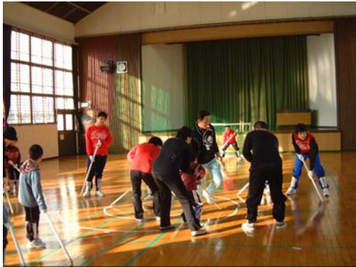
富山FHでは、実践に即した試合形式の練習も取り入れています

日間で8コマの練習をしています。どちらのプログラムも練習の前と後に必ずミーティングを開き、練習方法や練習成果などを打ち合わせながら進めます。