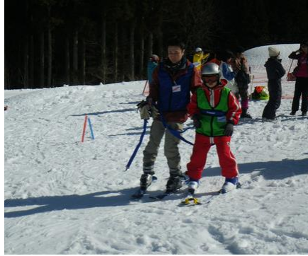
コーチのサポートで