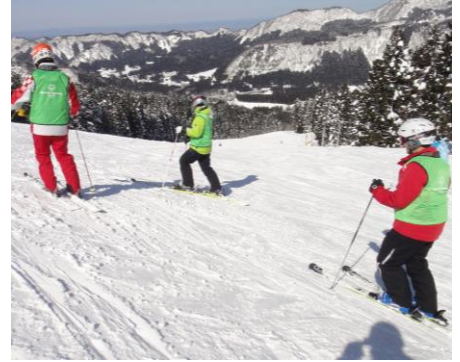
頂上から、さあ、出発だ!