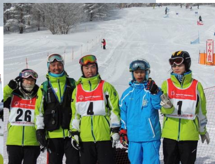
平昌冬季WGに参加したアスリートと一緒に