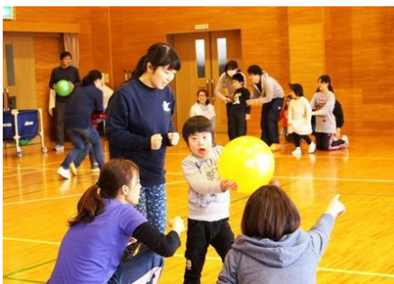
折り返し地点。「さあ、あと少し。がんばって」

ヤングアスリートプログラムとは、知的障害のある2~7歳の子供達(アスリート)のためにスポーツを基本に開発した“遊び”のプログラムです。ゲームや歌などを取り入れて楽しく体を動かすことで、運動能力の基礎を学ぶことを目的としています。アスリート6名、パートナー5名、あわせて11名が集まり、毎日にぎやかに活動しています。