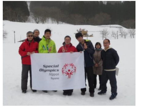
3月8日(日)スノーシュー競技会での記念撮影