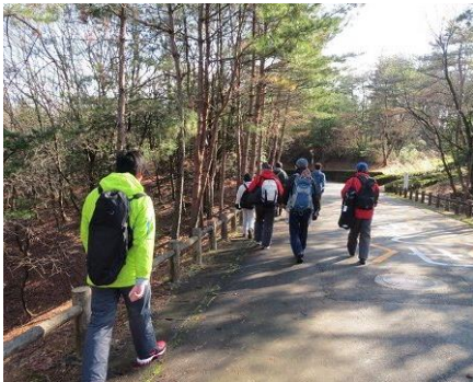
ランド内をトレッキング

太閤山ランドにて、第1回~4回目のスノーシュープログラムが行われましたが、今年は雪がありませんでした。第5~6回目、牛岳温泉スキー場、第7~8回目、競技会はいちょうバレーで行われました。