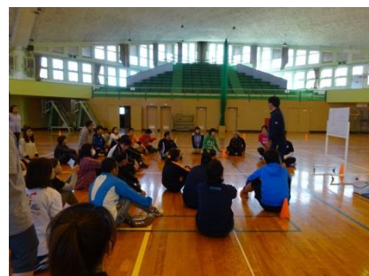
午後は説明の後、実際にプレイしました。