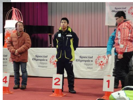
表彰されるアスリート