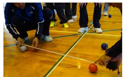
同じように見えるときは、ミリ単位で測れるメジャーで計測します