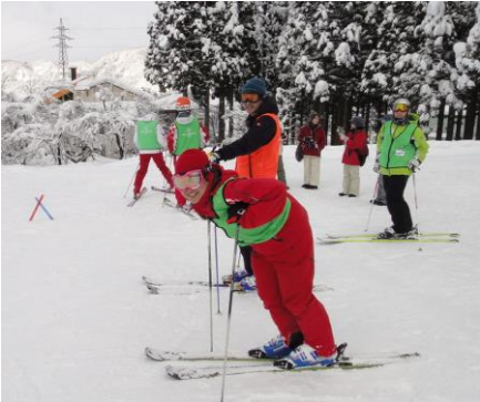
天候にも恵まれました