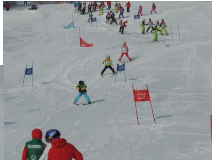
コース確認のため 試走しています