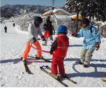
最初なのでスキーに慣れるところから練習

アルペンスキープログラムは、今年から、初中級と上級の2プログラムに分かれての活動になりました。