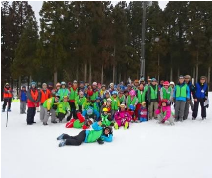
競技会での記念撮影