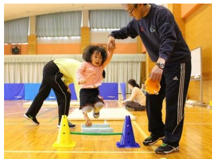
ウサギさんになってピョンピョン