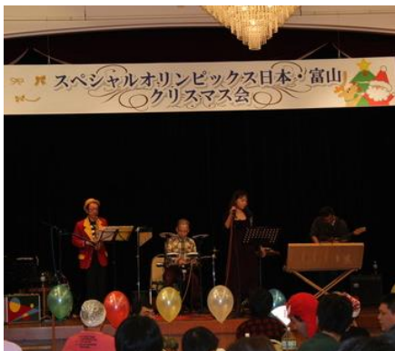
虹色音楽隊の演奏と歌