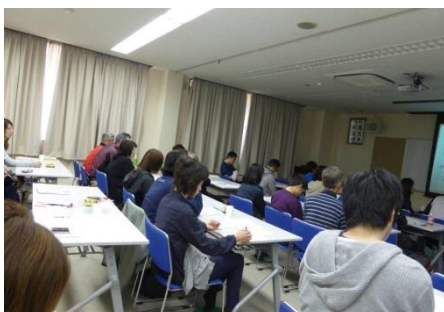
午前の部、参加者は 39 名でした