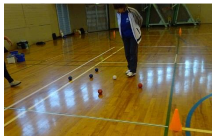
審判が厳しい目でボールの距離をチェックします