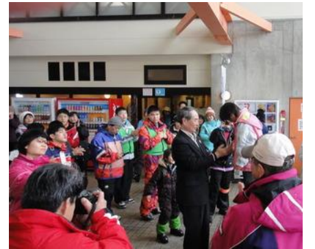
表彰されるアスリート