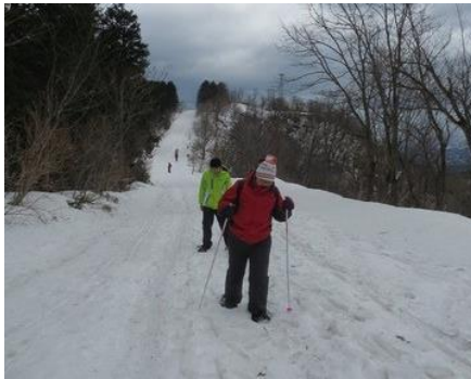
ゆるい登り、頑張ります