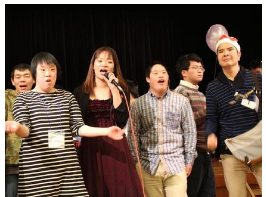
クリスマスソングや、アニメソングを楽しく歌いました