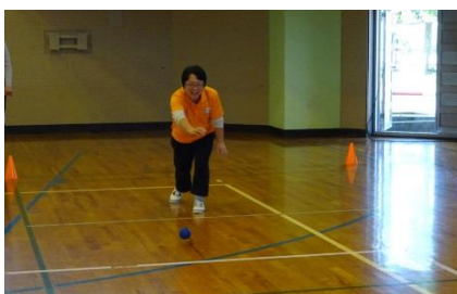
投げ方は、こんな感じです