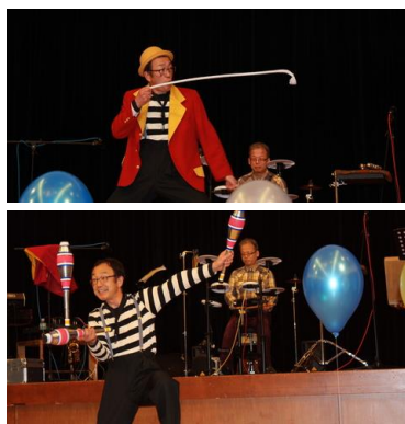
モン太郎さんのショー