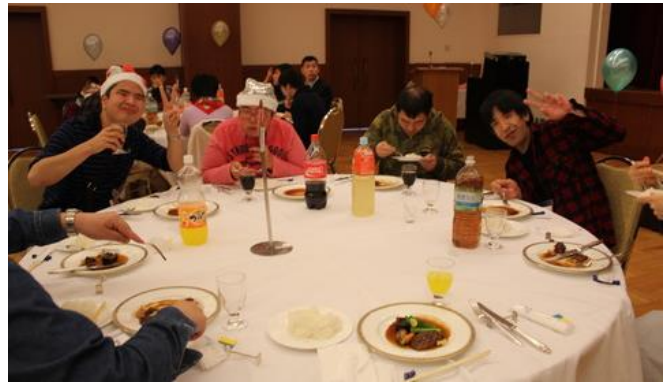
和やかな雰囲気の中、食事を楽しむアスリート