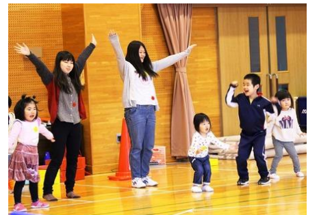
大きくジャンプ!!”子バナナ”のポーズです