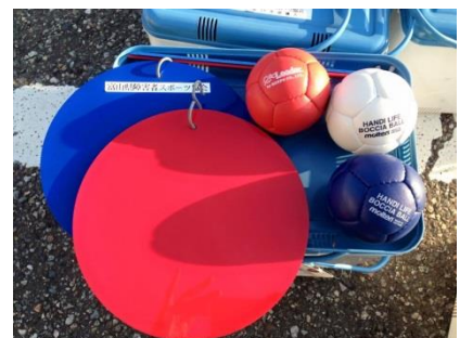
これがポッチャで使うボール、室内用です。