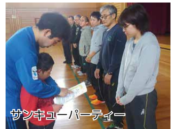
サンキューパーティー