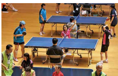
シングルの予選に臨む中山さん(手前)と方堂さん(奥)。