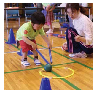
サークルに入れたらゴール！やったね☆