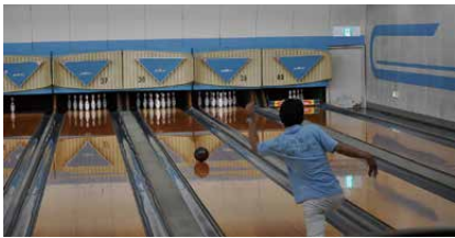
一投一投慎重に、そして大胆に投球！