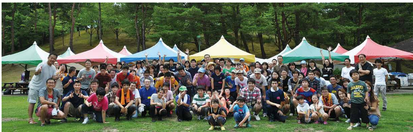
7月2日(日)に太閤山ランドで開催されたバーベキューには111名の方が参加してくださいました。

スペシャルオリンピックス (SO) とは、知的障害のある人たちに、日々のトレーニングと競技会を通じて、自立と社会参加をサポートする国際的なスポーツ組織です。SO では、これらのスポーツ活動に参加する知的障害のある人たちをアスリートと呼び、多くのボランティアやアスリートのファミリーと一緒に活動を支えています。SO の活動は、すべて非営利活動で、運営はボランティアの方々の積極的な意思と、善意の寄付によって進められています。現在、世界 170 カ国以上で、約 420 万人のアスリートと 100 万人以上のボランティアが日常的なスポーツ・トレーニングに楽しく参加しています (2014 年 4 月時点)。競技会は地区レベルから世界レベルまであり、世界大会は夏季・冬季共に 4 年毎に開かれています。国内でも全ての都道府県に普及していて、富山では現在、約 160 名のアスリートが 11 種のスポーツプログラムと 1 つの文化プログラムに取り組んでいます (2016 年 4 月時点)。