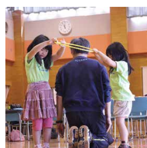
呼吸を合わせてサークルを持ち上げて、コーチを「つかまえたっ！」