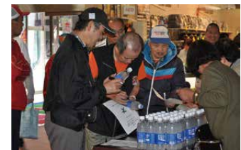
SON・新潟の皆さん。準備は万端！ 花椿の皆さん。

プログラムメンバーや SON・新潟のメンバー、福祉施設 花椿の皆さん、ボランティアの方々も参加してください、総勢90名がボウリングを楽しみました。