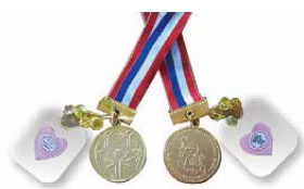
今大会のメダル。裏面は埼玉県のマスコット「コバトン」がトーチを持って走っています。かわいい！