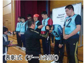
表彰式（チーム対抗）