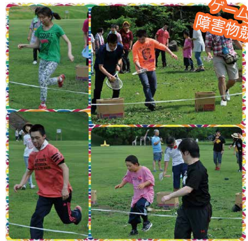
障害物競走は、玉運び⇒ロープ飛び⇒カード選び⇒ゴールへ。ゴールすると、ファミリー委員会からお菓子がもらえます。