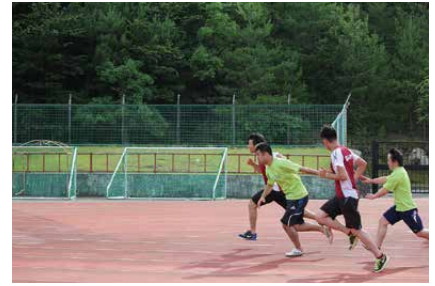
バトンパスの練習