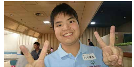
アスリート達はトロフィーをゲットしようと頑張りました…結果はどうでしたか？