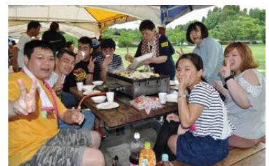
青年会議所の皆さん。チョコバナナのプレゼント、ごちそうさまでした！