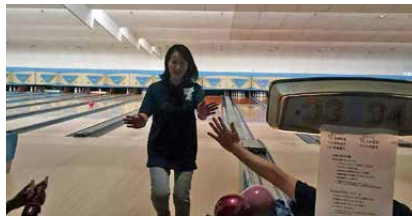
ストライク・スペアが出たら、お決まりのハイタッチ。