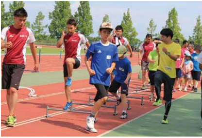
ラダーを使って太ももを上げる練習をします。