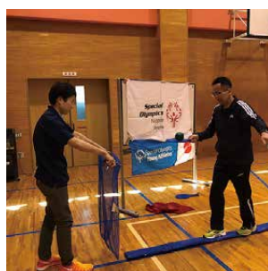
手元も足元もバランスをとって…「ん〜、難しいなあ。」