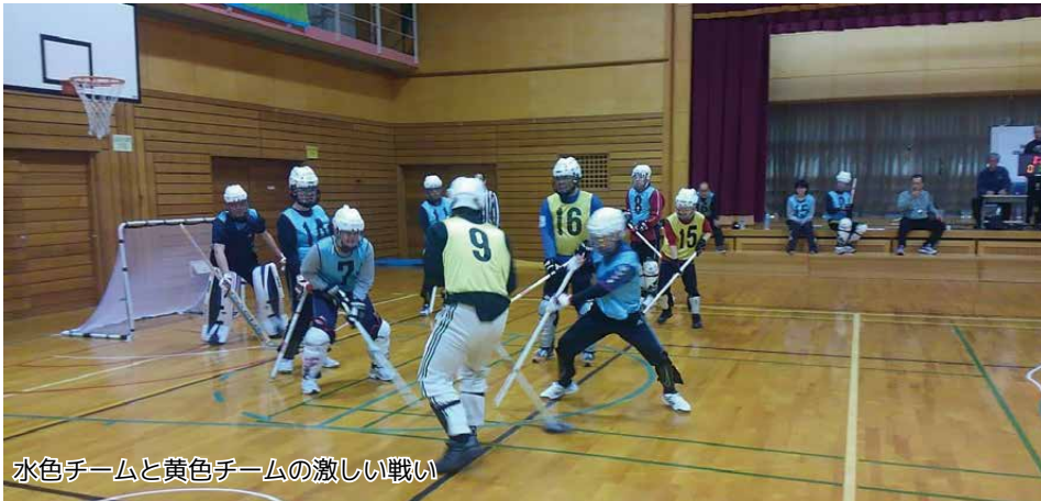
水色チームと黄色チームの激しい戦い