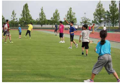
ボーテックス投げも行いました。きれいな放物線で投げられたら、ロケット花火のような音が鳴ります！