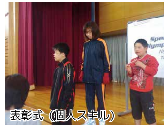
表彰式（個人スキル）