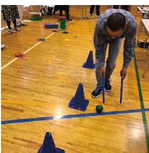
棒の先でボールを転がしながら、ジグザグ走行です。