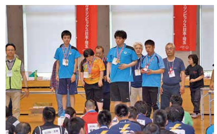
ダブルス部門の表彰式。嬉しそうな顔や少し悔しそうな顔も。