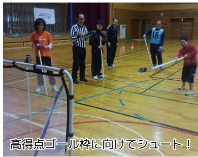
高得点ゴール枠に向けてシュート！