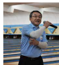
準備運動は大切！ SON・富山 森永ヘッドコーチと一緒にしっかり体を慣らします。