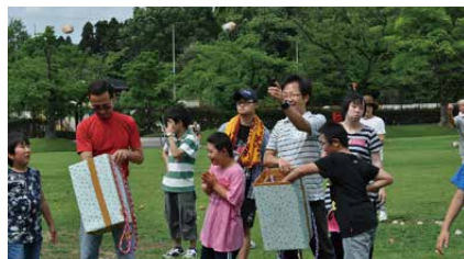
かごを担いだ人は、玉を入れられないように一生懸命逃げます。さて、いくつ入ったかな？